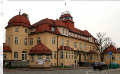
Rathaus Markkleeberg mit Lindensaal Text: M. Kothe

10. Oktober 2008 um 19 Uhr im großen Lindensaal stattfinden. Ein Bankett unter dem Motto „1813 kulinarisch“ lädt dann zum Probieren historischer Speisen ein. Kartenvorbestellungen unter kulinarisch@leipzig1813.com oder 0341 / 355 444 18